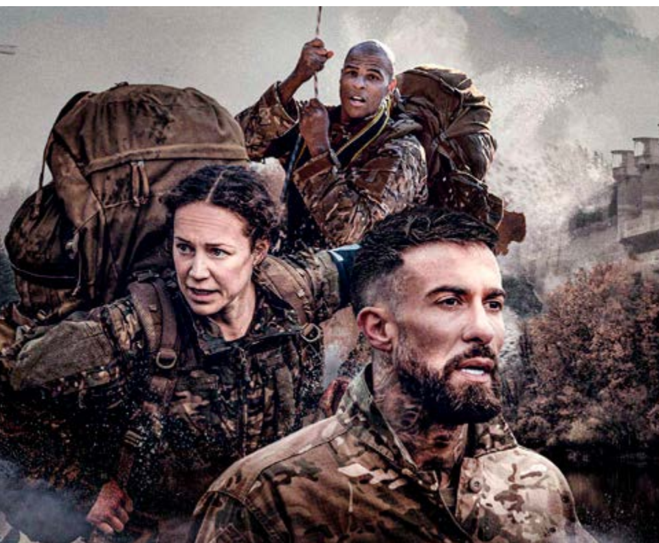
Special Forces VIPS

“De sfeer die over de opleiding hangt en de constante druk op de ketel. Het voortdurend niet weten wat je het volgende moment gaat doen. We willen er als kader voor zorgen dat deelnemers geen status, geen zekerheid en autonomie hebben – je bepaalt geen énkél moment wat jij zelf wilt en wat er in de toekomst gebeurt blijft onzeker. Dat geeft stress en druk, en bootst na hoe het in een missiegebied kan gaan. De activiteiten zelf, in water of werken op hoogte bijvoorbeeld, zijn geen doel op zich. Het zijn middelen om te laten zien hoe jij omgaat met stress. Wij leggen dan aan de deelnemers uit hoe die stressreactie ontstaat. Het is vervolgens interessant om te zien hoe ze ermee omgaan: de een begint in zichzelf te praten, een ander blokkeert of raakt in paniek. Zo krijg je dus heel goed inzicht in iemands mentale belastbaarheid. In het programma gaat het dus bewust niet over militaire vaardigheden als kaartlezen, schieten, etc. We weten allemaal dat dit veel langer duurt om echt aan te leren, dus het zou niet kloppen als je op basis daarvan kandidaten na 3 dagen de deur wijst.”