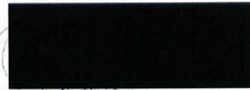
R.O.P Pulles CMHF