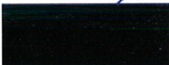
T.A.J. van den Berg ACOP

Met hoogachting, Namens de Centrales van Overheidspersoneel in de sector Defensie